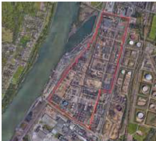
Figure 1 : localisation du site sur une photo aérienne

Le site est situé sur la commune de Petit Couronne. La superficie totale du terrain est de 69 507 m 2