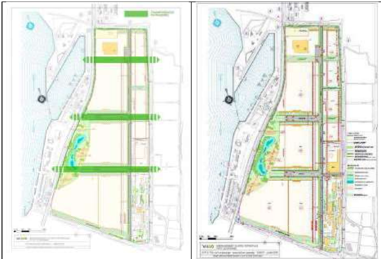
Figure 3 : Schéma des intentions et principe d'aménagement